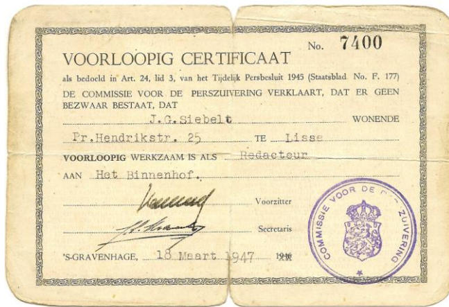
Voorlopig certificaat uitgegeven door de Commissie voor de Perszuivering.